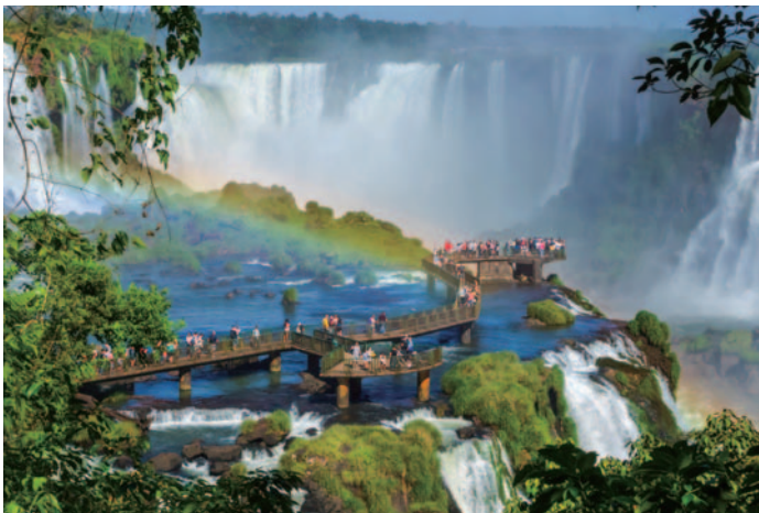
イグアス国立公園