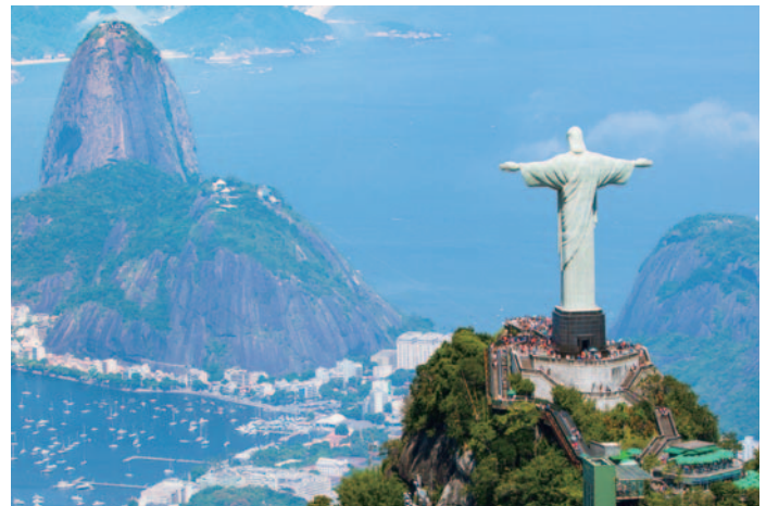
コルコバードの丘