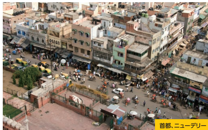
首都、ニューデリー