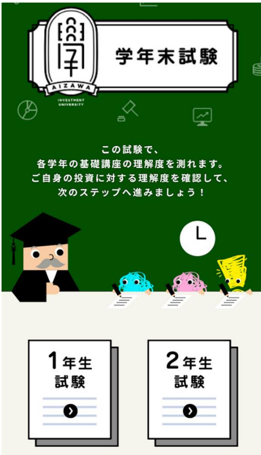
画面イメージ (学年末試験)