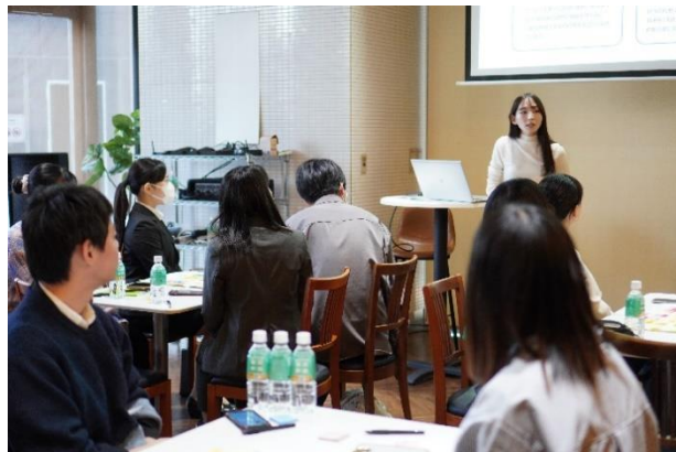
当社社員による投資やお金に関する講義