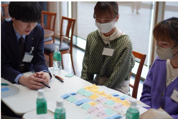
将来必要になるお金について整理するワーク