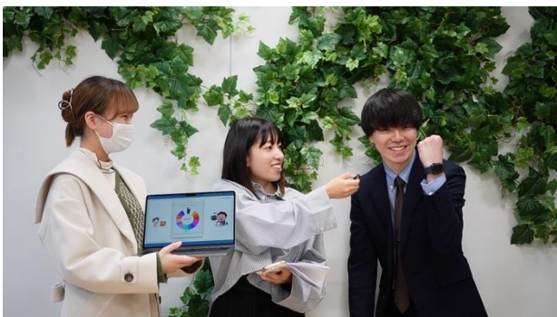
ルーレットで「ドキドキインタビュー」の様子