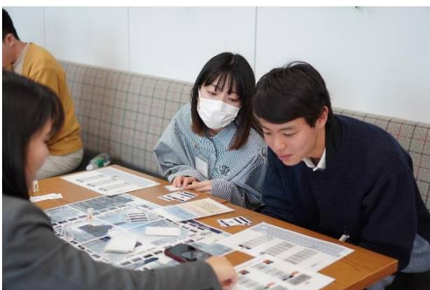
マネースゴロクを通して投資やお金について学ぶ様子